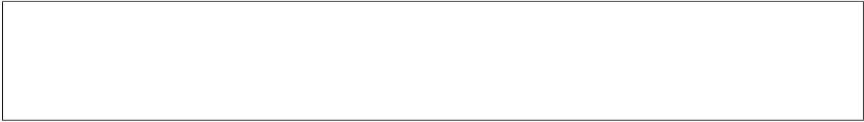
Tableau de fils

Écrire un programme qui reproduit la figure ci-dessous :