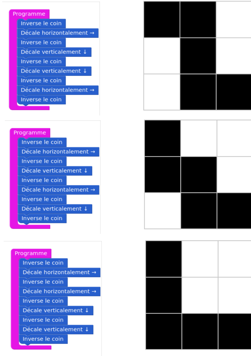
Figure 3: Configurations H-V-V-H, H-V-H-V et H-H-V-V