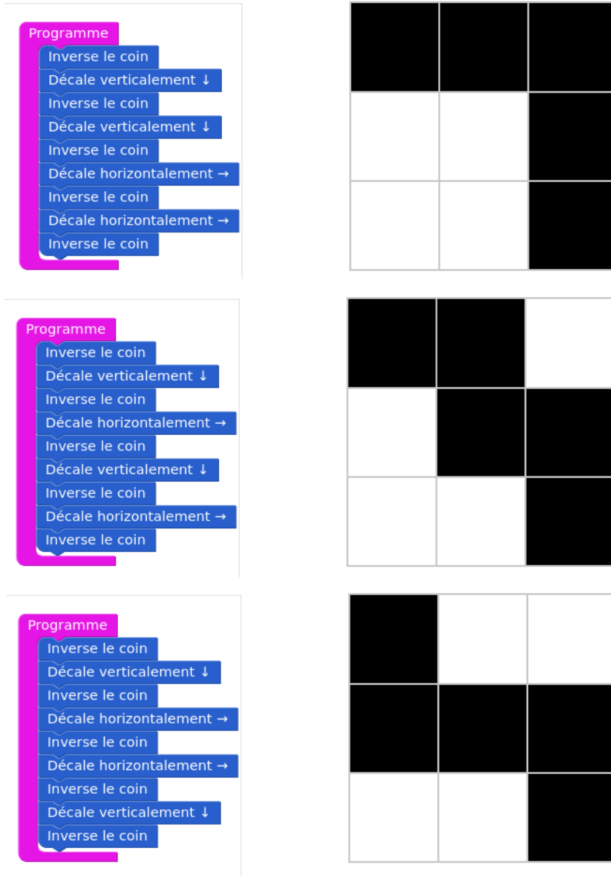
Figure 2: Configurations V-V-H-H, V-H-V-H et V-H-H-V